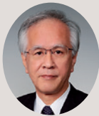
長崎大学長 片峰 茂